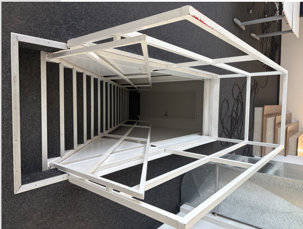
Treppe zum 1.OG