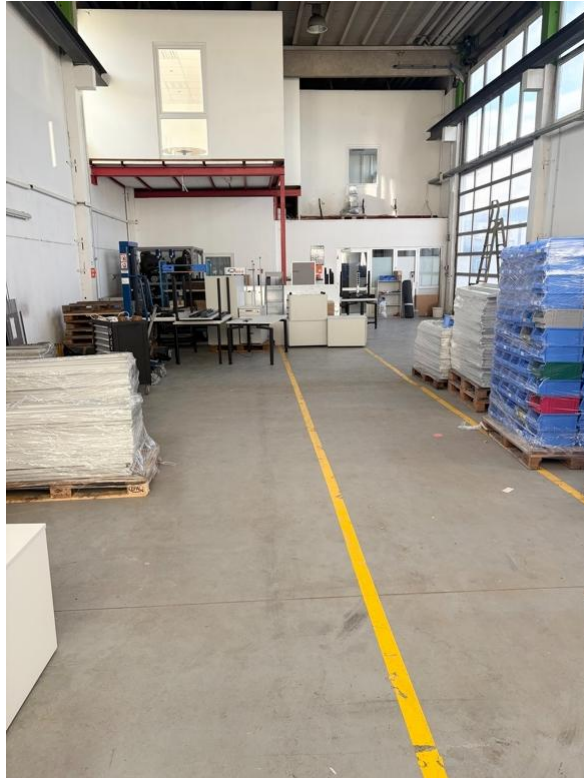
1. Innenansichten (3)