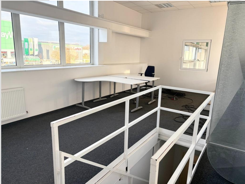
1. Innenansichten (4)