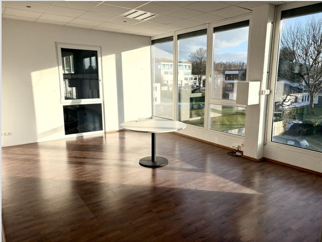
1. Innenansichten (5)